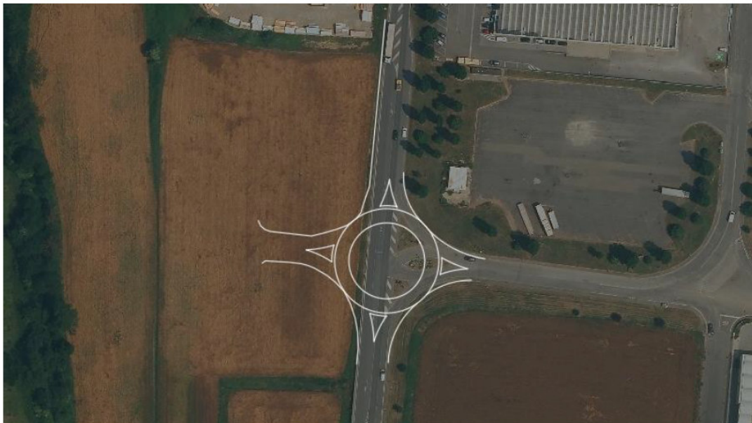
Figura 33 Ipotesi di rotonda (diametro 48 m).

si ricorda che ai sensi del Regolamento Regionale 41/R/2004 l'autorizzazione della Provincia di Arezzo potrà essere rilasciata sulla base della progettazione presentata.